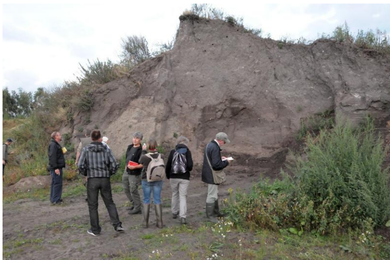
wat zal er met de oeverzwaluwen gebeuren?