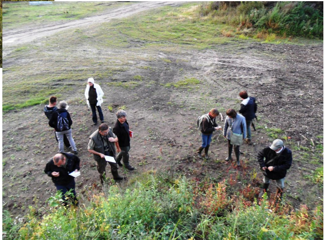
dan krijg je dit als effect