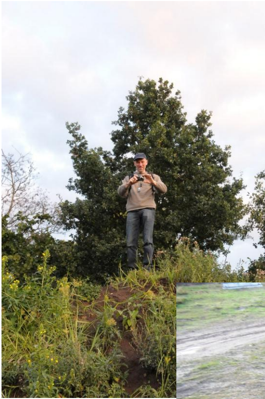
De fotograaf kijkt letterlijk op ons neer