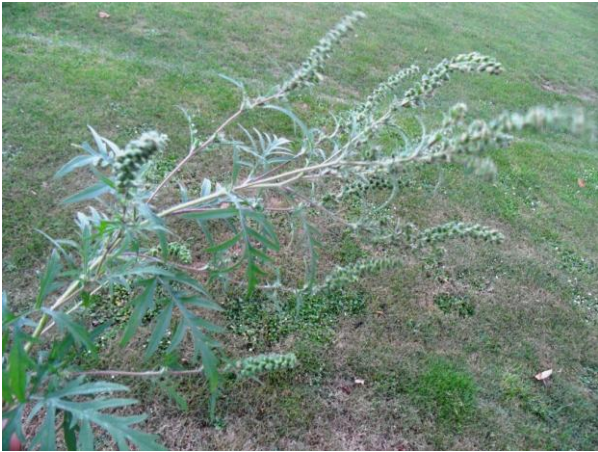
Alsemambrosia de nachtmerrie van hooikoortspatienten